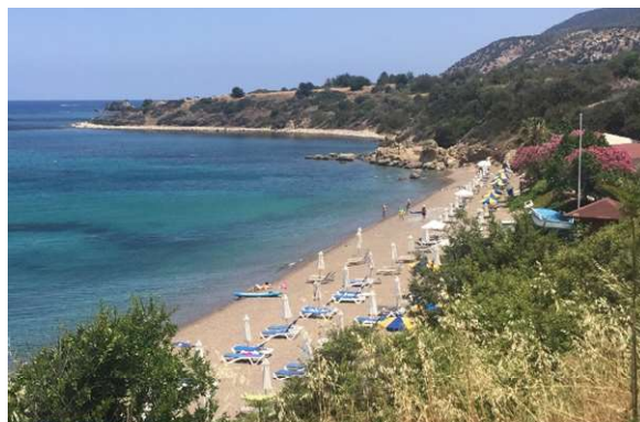
Kleinerer Strand mit Taverne