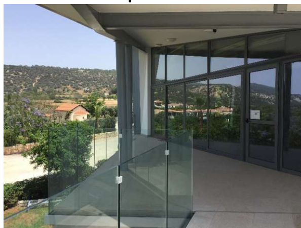
Einer der Seminarräume