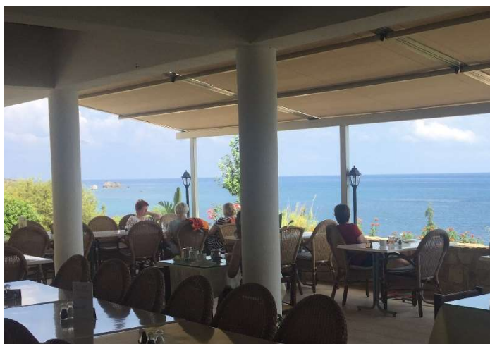
Blick von der Hotelterrasse