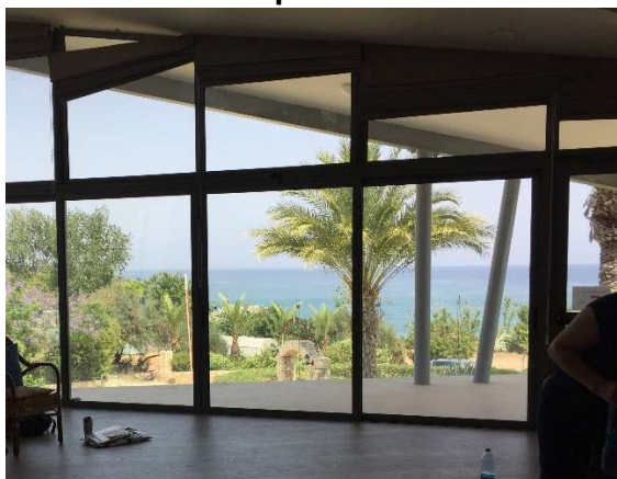
Blick aus einem der Seminarräume